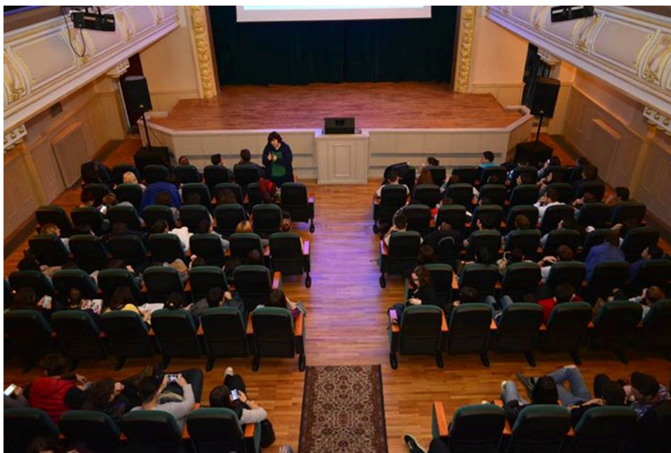
Colegiul National Matei Basarab, Bucuresti

La liceele participante - Colegiul National Sfantu Sava, Liceul de Arte Plastice Nicolae Tonitza, Colegiul National Ion Creanga, Colegiul Economic Viilor, Colegiul National Matei Basarab, Colegiul National Mihai Eminescu - One World Romania a proiectat 3 documentare de pe Sahia Vintage I („Scrisoare din orasul nou”, Titus Mesaros, 1978, 10’; „Pentru stranepoti, inca ceva despre Bucuresti...”, Paula si Doru Segall, 1980, 14’; „Va veni o zi”, Copel Moscu, 1985/1990, 12’).