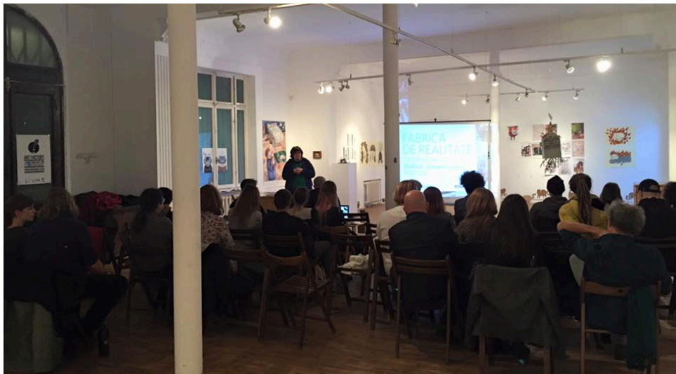
UNarte, Galeria Una, Bucuresti

Discutiile au atins urmatoarele puncte: estetica si durata filmelor (de ce faceau filme intr-un anumit fel, de ce aveau aceasta durata, cum si unde erau vazute, care erau ,normele', care era rolul studioului); impresiile tinerilor asupra istoriei recente avand in vedere faptul ca ei nu au trait-o; cum se rescrie istoria in functie de mesajele contradictorii cu care tinerii sunt bombardati (media, parinti, bunici, noi tendinte ideologice); impresiile profesorilor vis-a-vis de experientele redade de documentare, traite si de ei insisi; cenzura; propaganda; urbanizare; tehnologizare; centralizare; libertatea de expresie si lipsa ei; ideologii; periodizarea regimului comunist (cum se coloreaza cele patru decenii si cum sunt ele redade in documentarele din anii '50, '60, '70, '80).